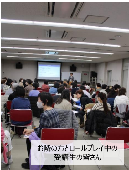
お隣の方とロールプレイ中の受講生の皆さん