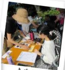
点字体験 コーナー