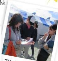
アンケートにご協力 ありがとうございました