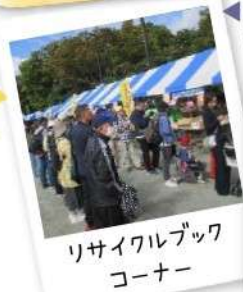
リサイクルブック コーナー