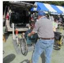
ハンディキャブ 試乗体験