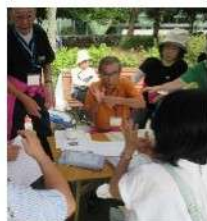
手話体験 コーナー