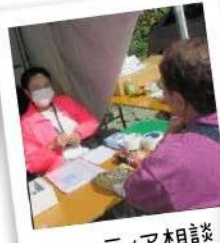
ボランティア相談 コーナー