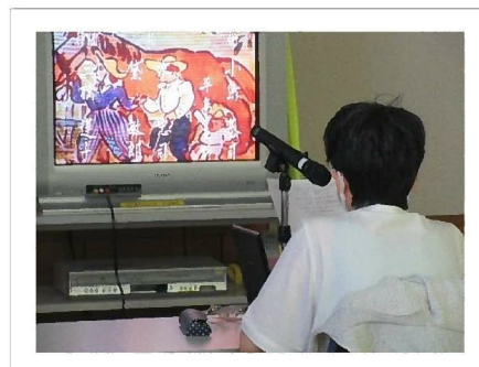
映像を観ながらナレーションを入れます。

ボランティアさん: 「講習会に参加し、この活動へ参加することになった。映画が好きで、この活動で観たこともない映画を観ることができ、楽しい。セリフとセリフの間にナレーションを入れるが、どのようにしたら視覚障害者へわかりやすく伝えられるか? いろいろ考え、表現する。表現したことが伝わったときは嬉しい! まだまだ勉強中です。」