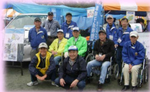
ハンディキャブ体験、車いす体験、車いす整備