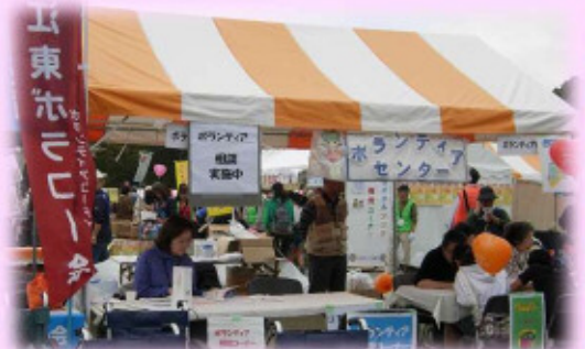
ボランティア相談コーナー