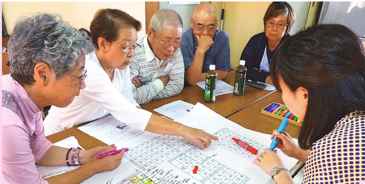
▲高齢者地域見守り支援事業での支え合いマップの作成 まずは地域を知ることから