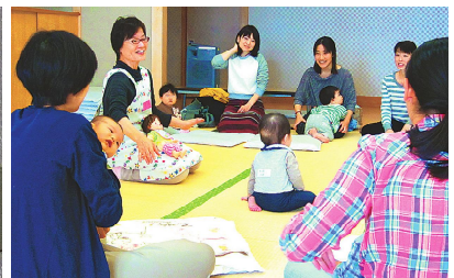
▲子育ての孤立感をやわらげる亀戸赤ちゃんひろば 毎月1回開催(亀戸文化センター)