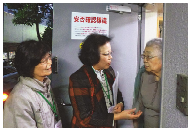
▲高齢者地域見守り支援事業 高齢者宅への個別訪問の様子