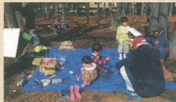
子育てサロン「さるえプレーパーク」アソビが江東

⑧ 地域のみなさんの交流事業への支援をします (地域で孤立しがちな方を囲んで住民同士が支え合う「ふれあい・いきいきサロン」活動を支援等) 3,769,000円 (19.6%)