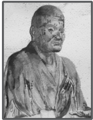
▲第31回金賞受賞作品 「無著蔵」(絵画)

【申込締切】平成25年11月29日(金) 【開催期間】平成26年1月22日(水)～24日(金) 【会場】江東区文化センター 2階展示ロビー (東陽4-11-3)