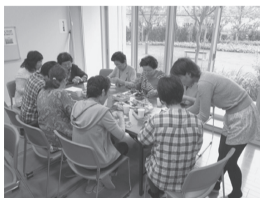
▲東雲サロン コサージュ作り

国家公務員宿舎東雲住宅をはじめ、東日本大震災の被災地より江東区内に避難している方々への戸別訪問を重点実施するとともに、サロンの設置、交流イベント等を継続実施し、行政・福祉関係団体等と連携した支援活動を実施します。