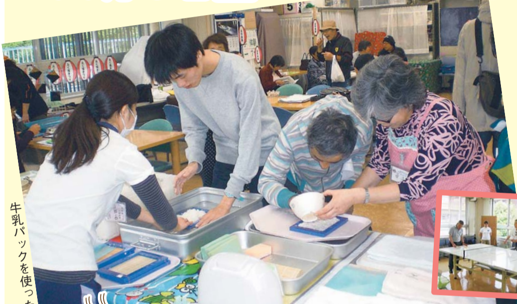
牛乳パックを使った紙すき体験