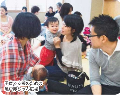
子育て支援のための 亀戸赤ちゃん広場