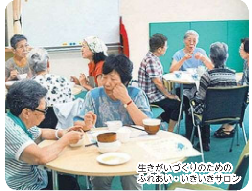
生きがいづくりのための ぶれあい・いきいきサロン