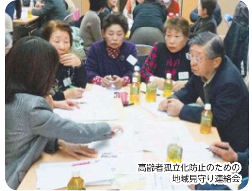
高齢者孤立化防止のための 地域見守り連絡会

『福祉のまちづくり』を応援してください 社協会員を募集しています 社協は、区民の皆さんの支え合い、助け合いの活動を広げ、その活動の支援をする福祉団体です。社協の会員として、社協を支援していただきたい会費は、福祉のまちづくりの貴重な財源となります。法人・企業の方々の加入もお待ちしています。