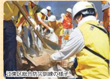
江東区総合防災訓練の様子