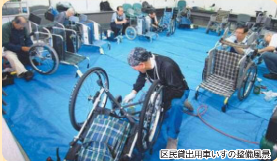
区民貸出用車いすの整備風景

今回は、高齢者施設などで車いすの無料点検を9年間続けている、「車いす点検整備ボランティアの会」にお話を伺いました。