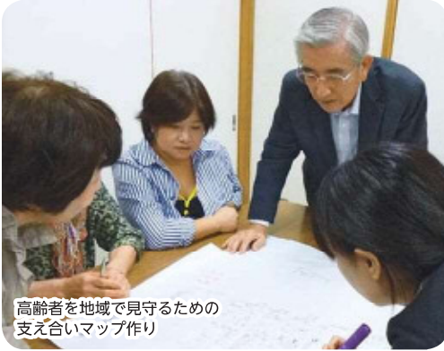
高齢者を地域で見守るための 支え合いマップ作り