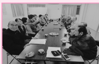
▲ふれあいサロン 2号棟なごみ会(南砂住宅)