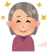
協力会員 Sさん (60代女性)

ファミリー・サポート事業は、区内で子育てのお手伝いを必要とする方（利用会員）とお手伝いができるボランティアの方（協力会員）が会員となり、信頼関係を築きながら、地域での子育てを支えていく事業です。地域で活躍している協力会員に、活動の様子についてお話を伺いました。