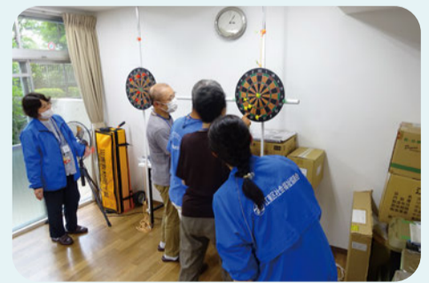
▲地域福祉コーディネーターの居場所づくり支援の様子