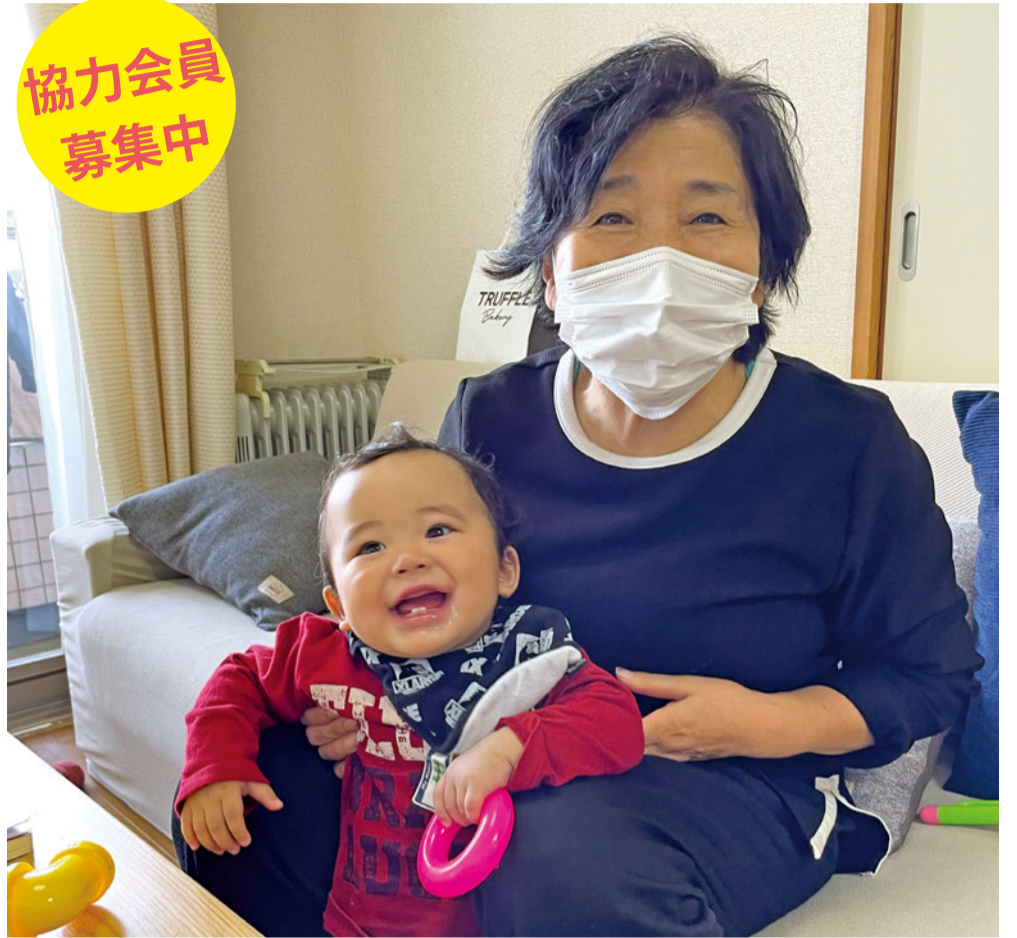
▲協力会員 Kさん（活動中の様子）

お子さんの一時預かりや保育園への送迎などを通じ、地域での子育て支援をしてみませんか？