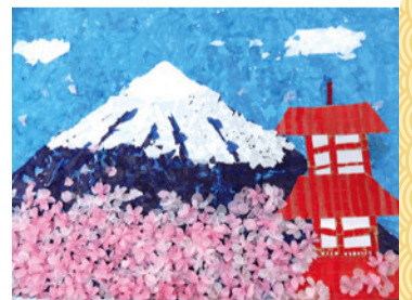
昨年度の出展作品（一部）