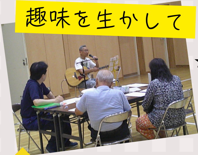
☆サテライトカフェ でのギター演奏