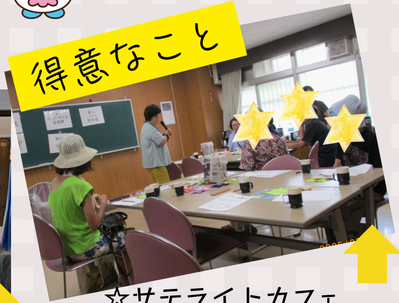
☆サテライトカフェ での講師（創作活動等）