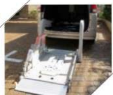
▲リフトが付いています